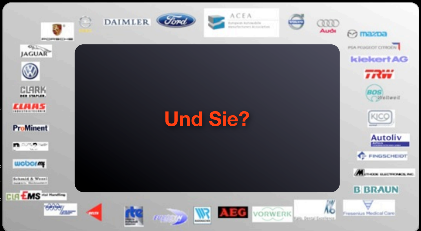
Die Logos der jeweiligen Firmen sind deren Eigentum.